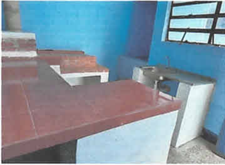
foto 1: finalizacion de instalacion de desayunoador con espacio de almacenamiento incluye lavatrastos