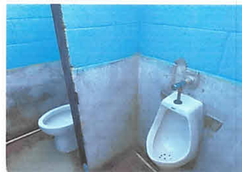
foto 2: finalizacion de instalacion de baño, lavamanos y urinario mejoramiento de puerta y ventanas