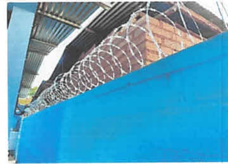
foto 12: finalizacion de pintura de muros exteriores del centro educativo

Observación: Si es necesario se pueden agregar hojas adicionales y actualizar el número de hojas.