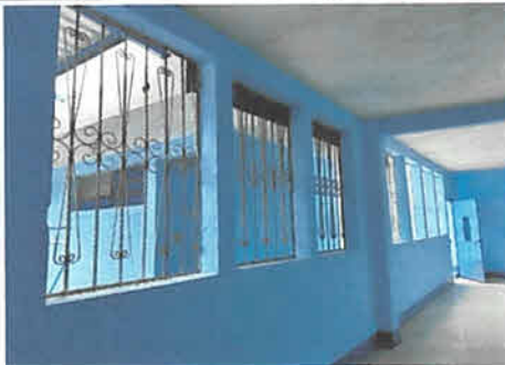
foto 11: finalizacion de pintura de muro interiores del centro educativo