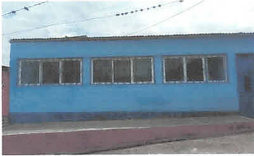
Foto 7: Finalización de instalación de ventanas de pvc y balcones